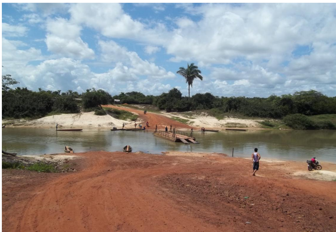
Figura 3 – Área que separa a sede de Nina Rodrigues do Assentamento Palmares II Autor: COELHO, Adriana Araujo/Junho de 2012

O assentamento em estudo foi criado em 2000, Possui uma área de 12.364 hectares com 380 famílias assentadas e fica localizado em Nina Rodrigues-MA aproximadamente 20 km da sede. A figura 3 mostra o Rio Munin que separa o Projeto de Assentamento da sede.