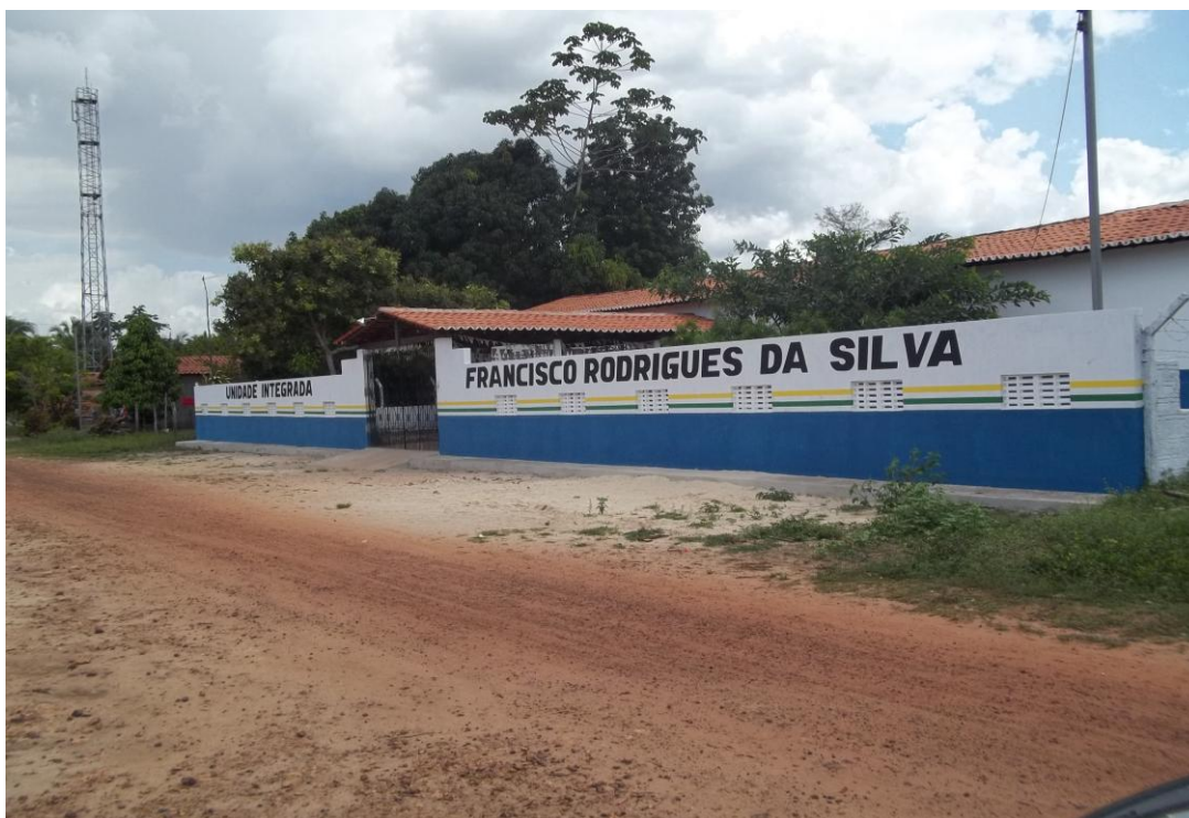
Figura 4 – Escola que atende aos discentes residentes no Assentamento Palmares II Autor: COELHO, Adriana Araujo/Junho de 2012

O Assentamento em estudo possui uma escola que é fruto das reivindicações dos movimentos sociais denominada de Unidade Integrada Francisco Rodrigues da Silva que fica localizada no Assentamento Palmares II, atendendo alunos residentes no Assentamento e funciona na modalidade seriada (figura 4).