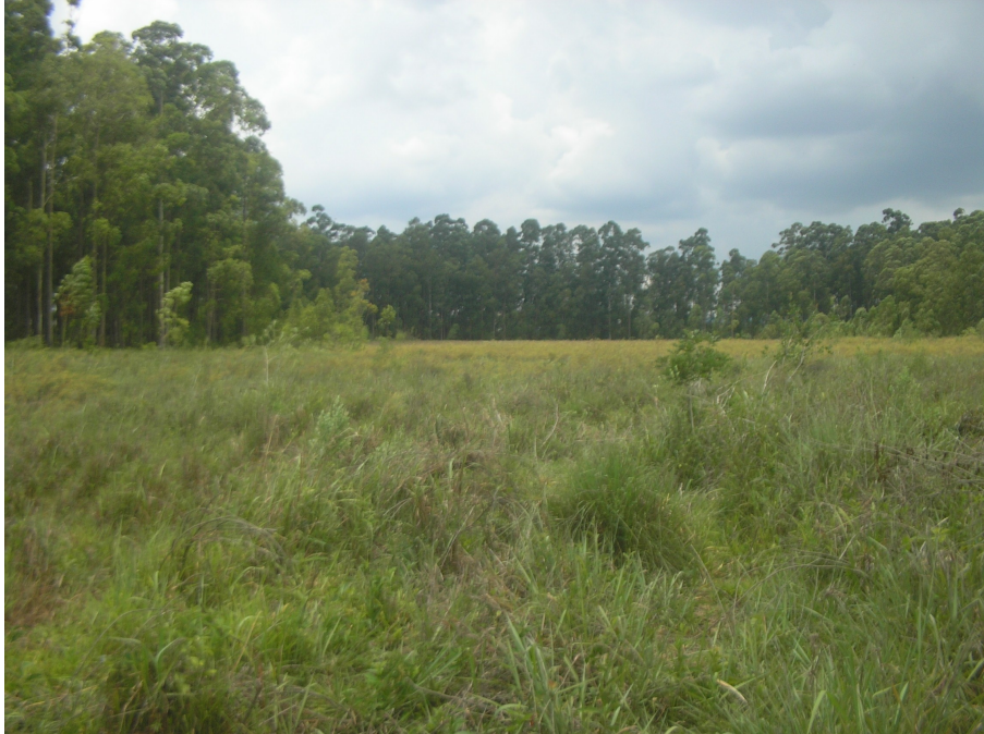
Imagem I. Vegetação de gramíneas, presentes na área antes do início das atividades de preparo de solo.

A área de APP foi encontrada com os seguintes aspectos e condições: plana com características de encharcamento em anos com alta pluviosidade, espécies de gramíneas e uma faixa de eucalipto sob preservação a 50m do curso do rio (Imagens I e II).