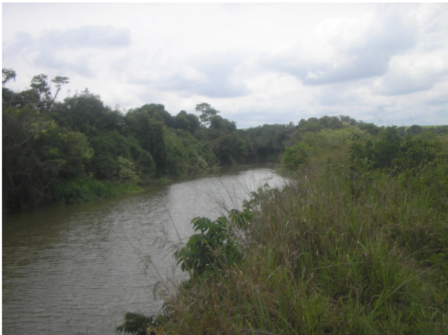
Imagem II. Curso do Rio da área de R.APP.